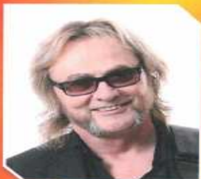
Breen LeBoeuf , chanteur et musicien bien connu, ayant fait partie des groupes Offenbach et April Wine.