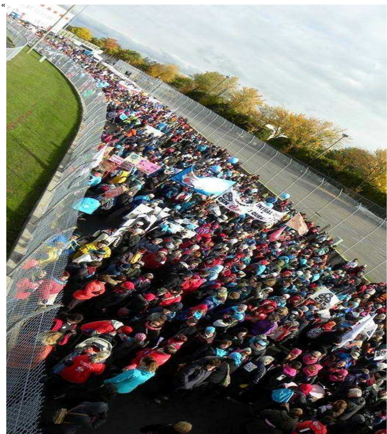
Cette image parle d'elle-même.