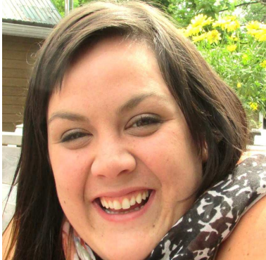
rédigé par Amilie, travailleuse milieu

C'est le mois de l'entrepreneuriat et je trouvais intéressant d'élargir le concept vers une sphère plus personnelle, plus intrinsèque. Selon l'Office de la langue française, la définition de l'entrepreneuriat est : « Fonction d'une personne qui mobilise et gère des ressources humaines et matérielles pour créer, développer et implanter des entreprises. » Je me suis questionné moi-même à savoir ce que je croyais être un bon entrepreneur. Les réponses qui me venaient instinctivement étaient teintées de valeurs un peu mercantiles du genre : quelqu'un qui a de beaucoup d'argent et qui passe son temps à travailler au détriment des autres aspects de sa vie. Pourtant, ce mot ne doit pas être un concept unique et dénué d'autre sens. Alors, je me suis amusée à renverser la vapeur en mettant de l'avant les qualités d'un entrepreneur mais au